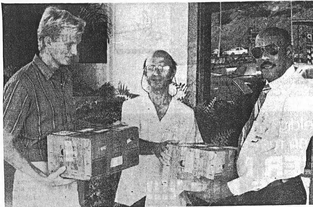
WILLEMSTAD -- Op de foto zien wij van links naar rechts

voor hoop is dat de in het wild in sommige landen zwaar bedreigde leguaan, niet uitgeroeid zal worden.